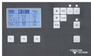
Écran bien structuré et facile à utiliser

La puissante pompe garantit le dosage exact de tous les types de buvée (PDL, lait et yaourt).